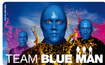
「TEAM BLUE MAN 会員証」券面 ※写真はイメージです。